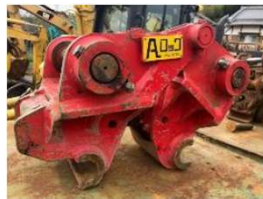
各種ロック・クイック